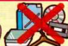
製品プラスチック