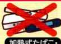
加熱式たばこ・電子たばこ