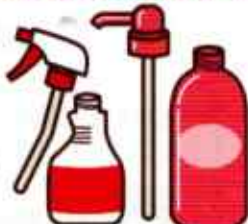
プラスチックボトル