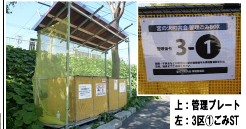
上:管理プレート 左:3区①ゴミST

ゴミステーションの老朽化が進んでおり、8月・9月には2区と3区のゴミステーションの改修が行われましたが、今後も引き続きゴミステーションの快適化を進めてまいります。同時に、10月9日には町内ゴミステーション計59ヶ所に管理プレート貼付の作業が行なわれました。