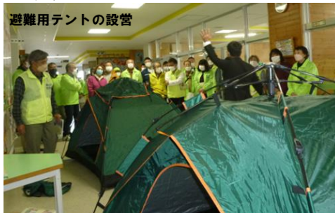
避難用テントの設営

今後の 主な行事 予定です。 皆さまのご参加 をお待ちしてい ます。 事情により中止と なる場合があります