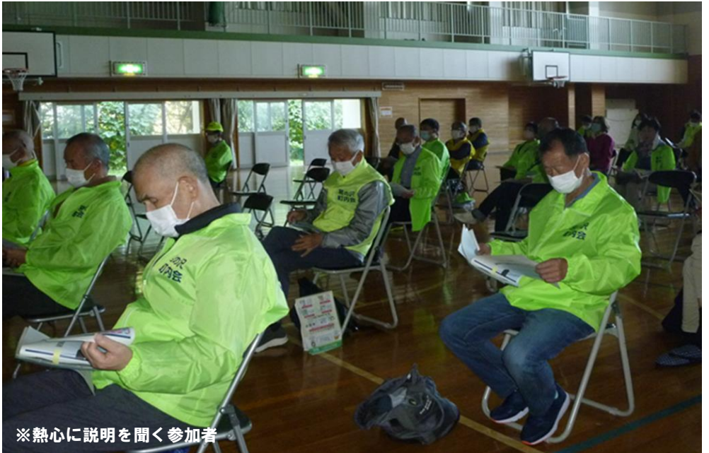
※熱心に説明を聞く参加者

10月16日、手稲宮丘小学校において、昨年2月につづいて2回目となる宮の沢町内会自主防災委員会主催による町内会防災研修が役員、関係者60名が参加して行われました。