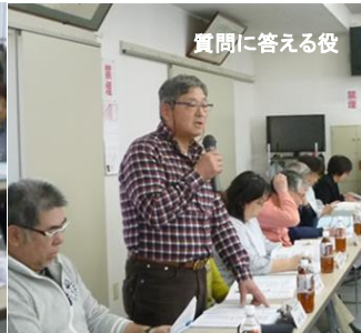
質問に答える役員