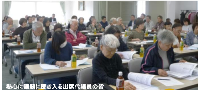
熱心に議題に聞き入る出席代議員の皆様