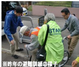
※昨年の避難訓練の様子

平成28年度から開始した土砂災害に特化した防災の取組みを様々な災害にも対応させるために、本年度発足した自主防災委員会が地域の様々な事業者や団体の協力を得て推進していきます。災害時支援を希望する人は年々増加していますが、助ける側となる支援協力者は、共稼ぎや高齢となっても働いている方も多く、現在400名が登録されている支援協力者の方々も災害発生時にはその20%程度の参加しか望めません。支援協力者の登録者数拡大が最大の課題となります。