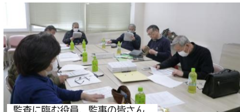
監査に臨む役員、監事の皆さん

5月に予定されておりました定期総会に置いて報告・承認を受けるよう準備しておりましたが、新型コロナウイルス感染問題によって定期総会が延期されておりますので、改めてお知らせいたします。ご理解よろしくをお願いいたします。