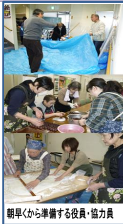
朝早くから準備する役員・協力員

お腹いっぱいのは、手作りのすごろく、百人一首、おりがみ、お絵描きなど、お友達と楽しい時間を過ごしました。