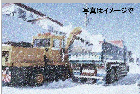
写真はイメージで

「雪が降ったらやれば良い」との意見もありましたが、排雪業者の方から「排雪の工程が決まっているため機材のやりくり、ダンプカーの手配など対応ができない」のが実情です。既にお支払いいただきました負担金は各班長を通して返金をさせていただきました。お手数をおかけいたしました。が宜しくご理解願います。今後ともご協力をお願い申し上げます。