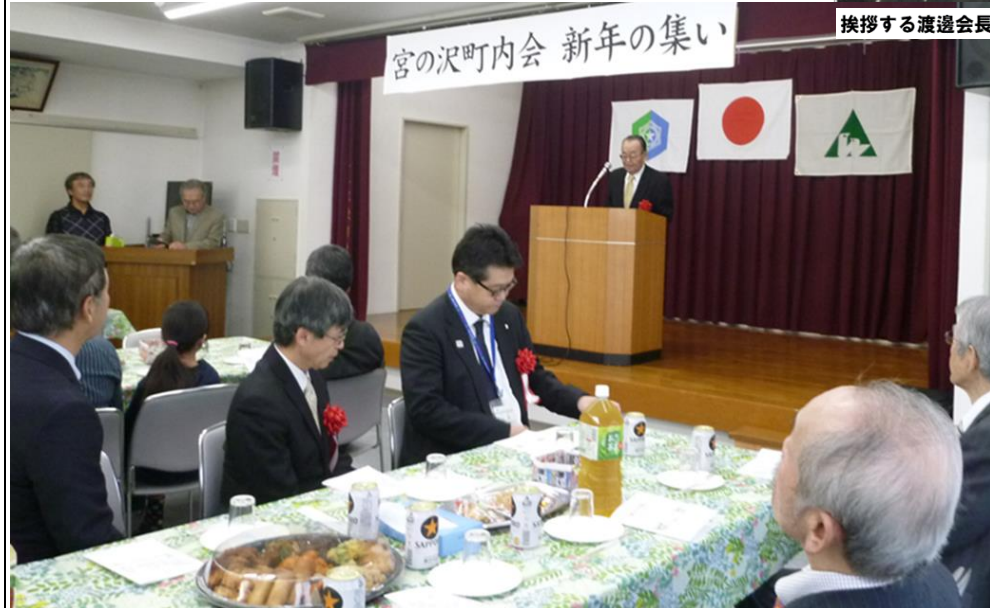
宮の沢町内会 新年の集い

1月12日(日)宮の沢会館に於きまして、令和2年の新春の集いが開催されました。令和元年度の班長さん、昨年の町内会の行事に協力をいただいた皆さん、小中学校を始め町内の学校、事業所の代表の方々のご参加いただき、町内会役員と合わせ約50名の参加で行われました。