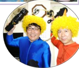
鬼役を務めていただいた 宏友会の方々